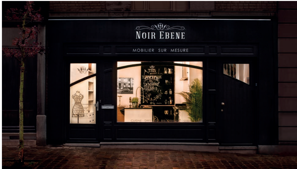
Une réalisation de Vendredi.